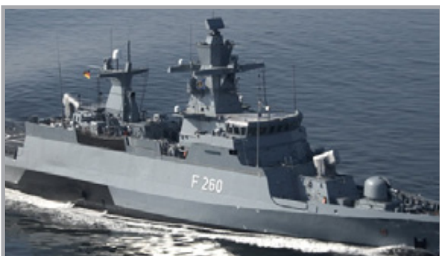
11000 enheter til Tyske Marine