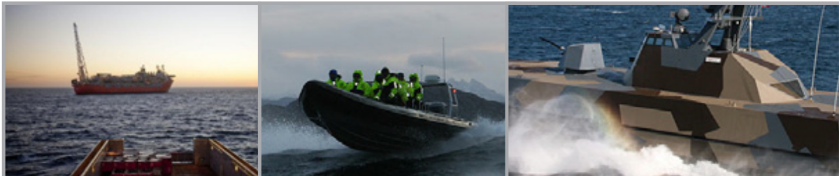
Optimal personsikkerhet under tøffe forhold

Veil pris type A049 easyRESQUE-A kr. 5 440,- eks.mva.