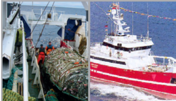
For yrkesbruk på dekk