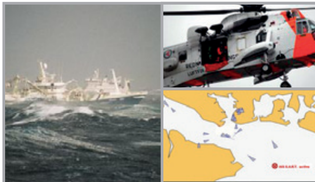
AIS SART nødpeilesender