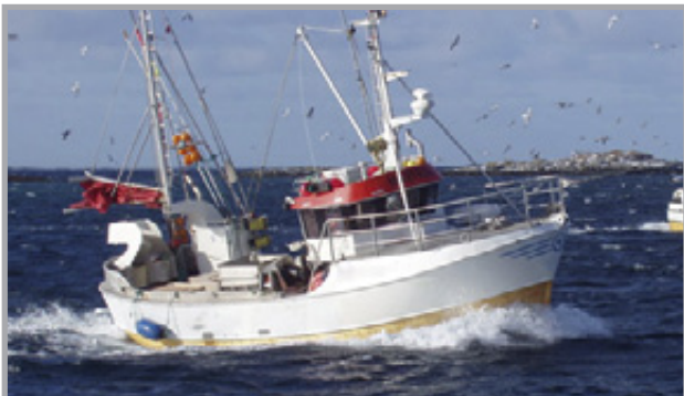
AIS SART Automatic